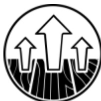
Na ogrzewanie podłogowe