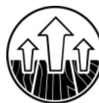
Na ogrzewanie podłogowe