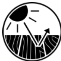
Odporna na promienie UV